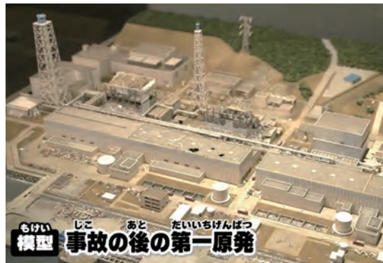
事故の後の第一原発