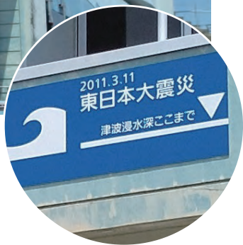
しんさいいこう 震災遺構 なみえちょうりつうけどしょうがっこう 浪江町立請戸小学校